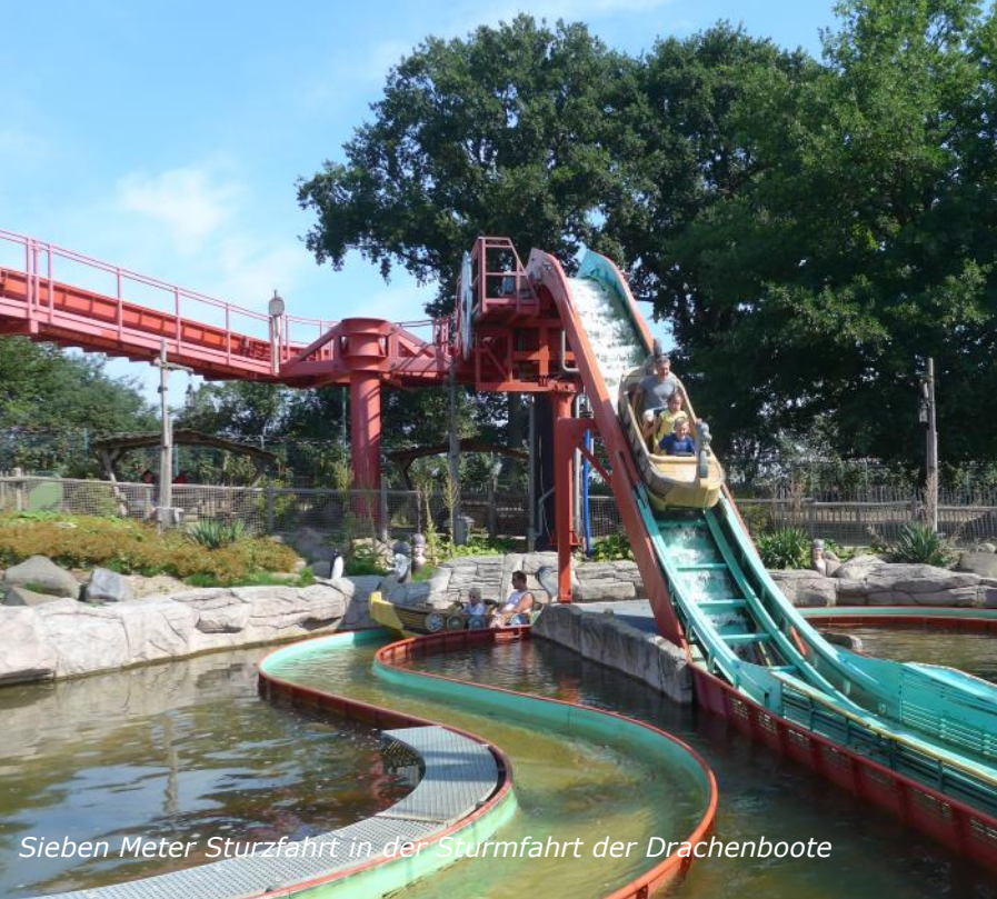
Sieben Meter Sturzfahrt in der Sturmfahrt der Drachenboote