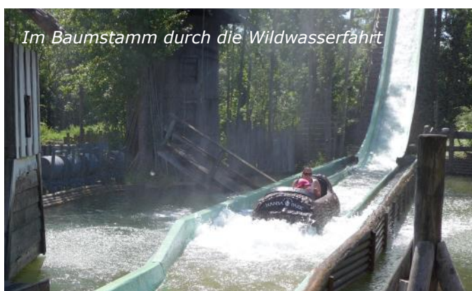
Im Baumstamm durch die Wildwasserfahrt