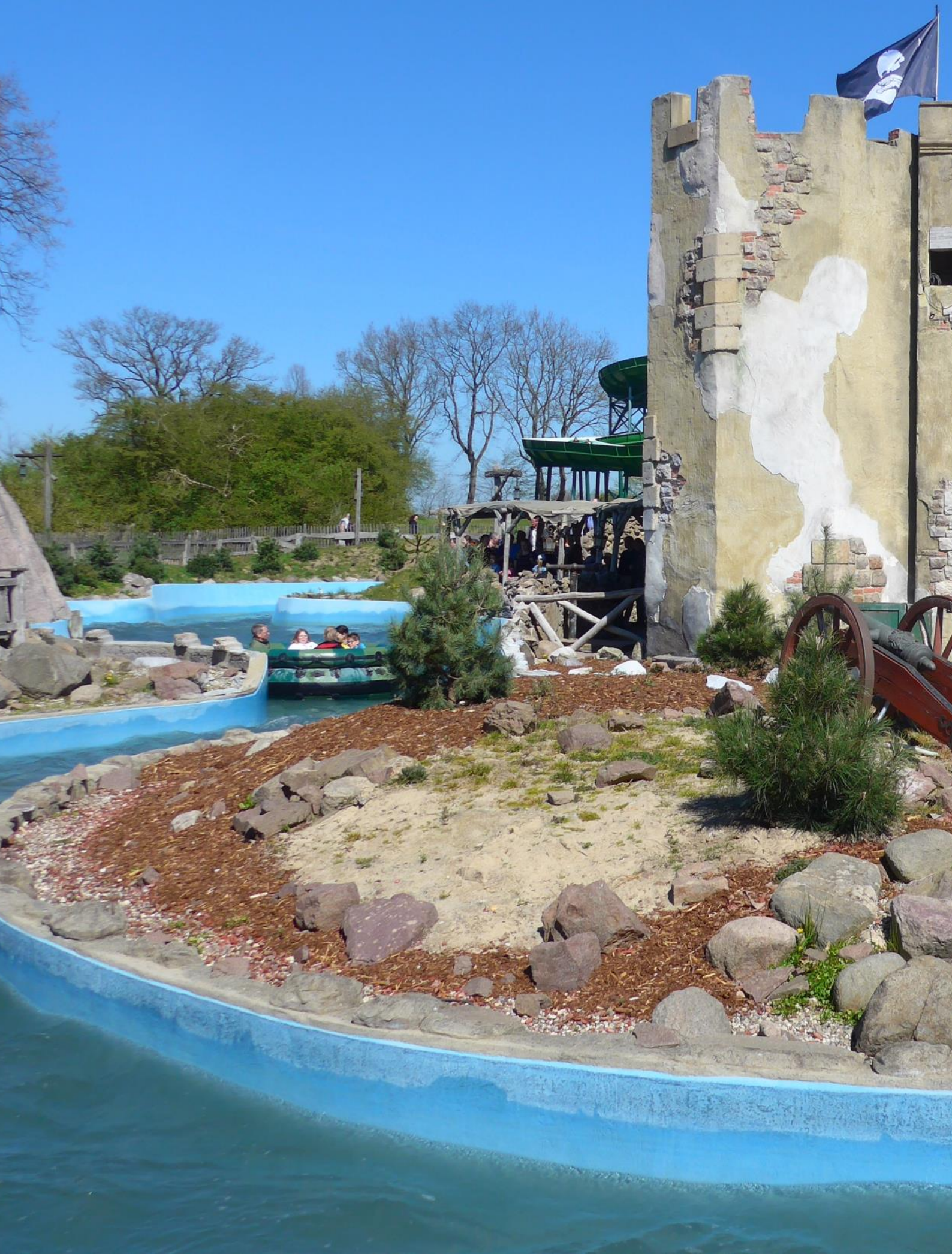
Im Rundboot rund um die Burg von Störtebekers Kaperfahrt