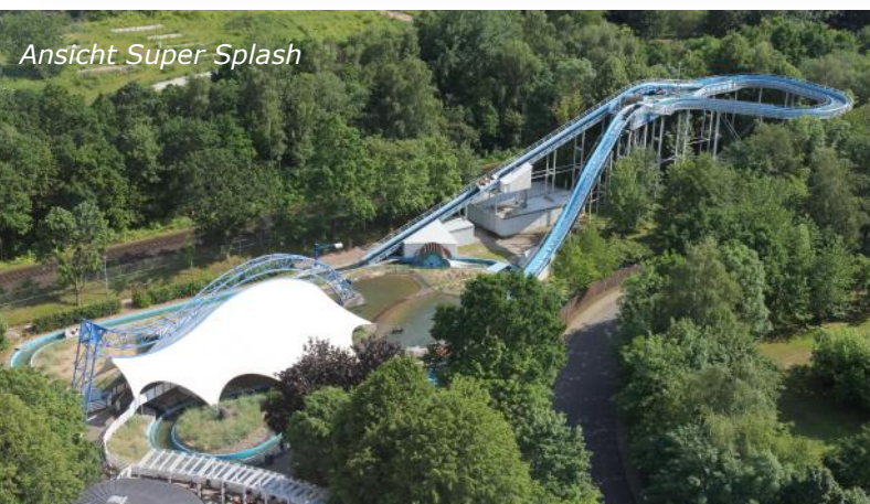
Ansicht Super Splash