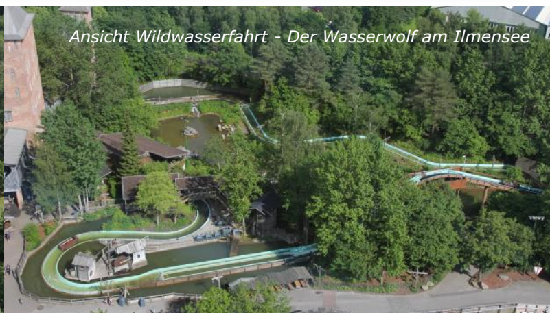
Ansicht Wildwasserfahrt - Der Wasserwolf am Ilmensee