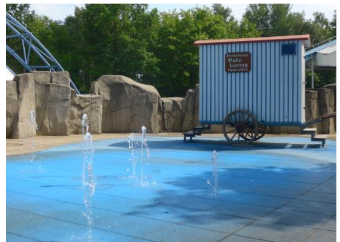
Spritzwasser an den Auslaufbereichen der Wasserbahnen (links) und Wasserspaß vor dem Ostseebadekarren (rechts).