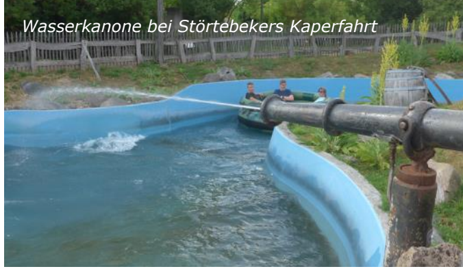
Wasserkanone bei Störtebekers Kaperfahrt