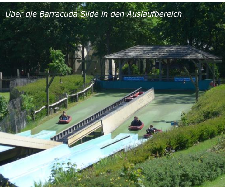
Über die Barracuda Slide in den Auslaufbereich