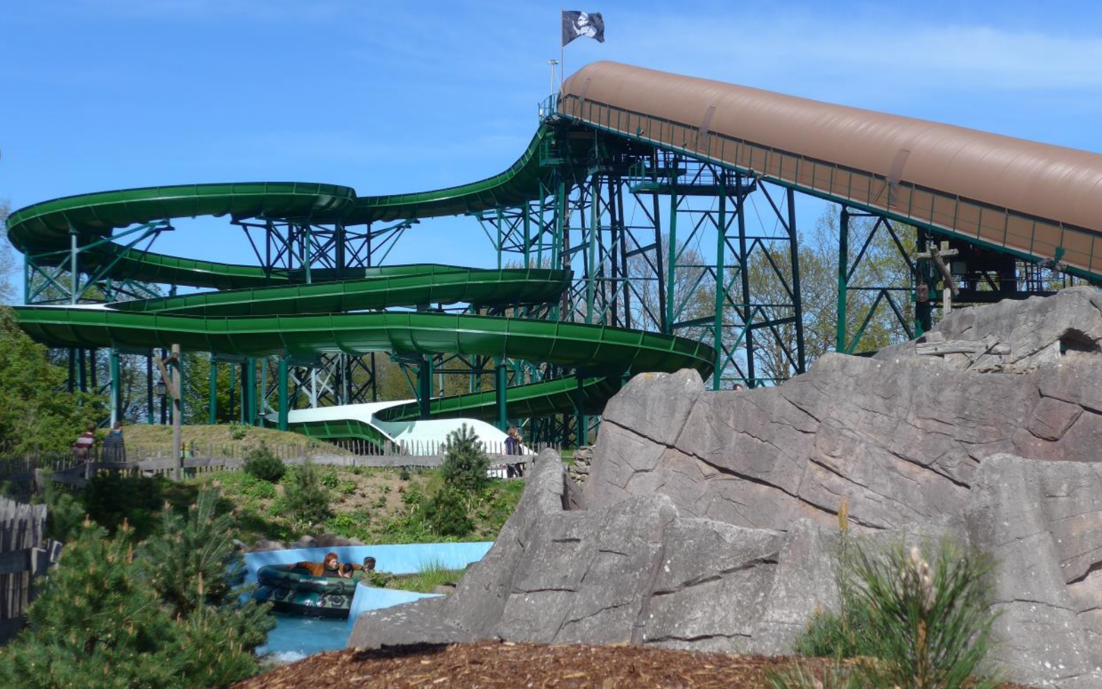
Bei Störtebekers Kaperfahrt kreisen die Boote zunächst durch einen Kanal nach unten (oben) während es in Barracuda Slide direkt vom Turm auf Abwärtsfahrt geht (unten).

Erwachsenen mächtig Freude bereiten. Zumindest wenn die Drachenboote aus sieben Metern Höhe ins Wasser hinab rauschen. Die Abkühlung der Sturmfahrt der Drachenboote ist wahrscheinlich größer als erwartet. Einzige Nachteile: der Wartebereich liegt komplett ungeschützt und Erwachsene müssen alleine fahren.