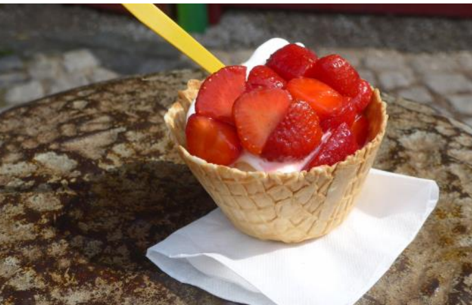
Energiespendendes Superfood wie Bruschetta mit Tomate und Avocado (oben), eine Portion Frozen Yoghurt mit frischen Erdbeeren (mitte) und Schatten unter großen Sonnenschirmen (unten).