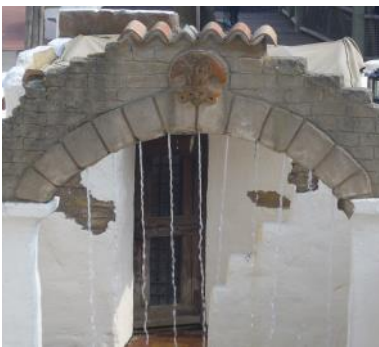
Wasservorhang am Ende des Camino del Mar (links), spritzende Fontänen in der Piratentaufe (mitte) und Fontänenaction beim Sprechenden Brunnen (rechts).

Showzeiten Saison 2019 13:30 | 15:30 Uhr (Dauer je 15 Min.)