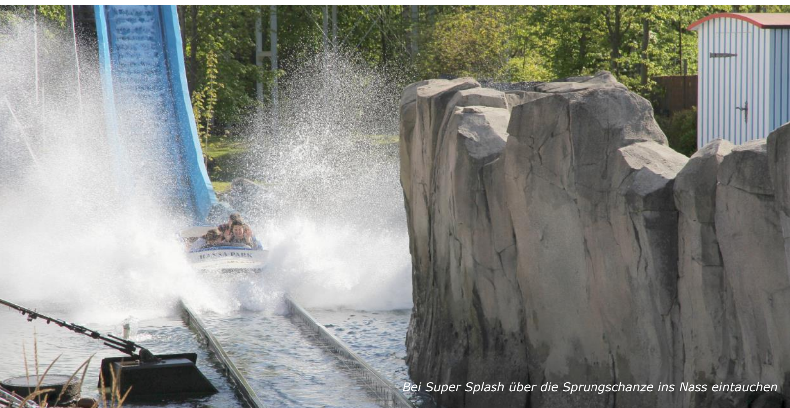
Bei Super Splash über die Sprungschanze ins Nass eintauchen